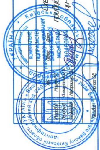
Схема придбання будівельної території пр-т Шевченка, 5