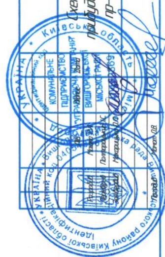
Схема придбання приміської території пр-т Шевченка, 9