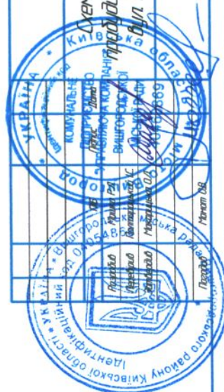
Схема прибудинкової території буд. № 12