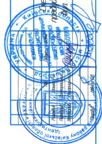
Схема прибудинкової території буд. Хмельницького, 7